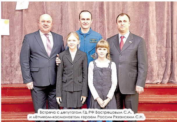
Встреча с депутатом ГД РФ Вострецовым С.А. и лётчиком-космонавтом Героем России Рязанским С.Н.

Юрий Гагарин совершил исторический полет вокруг Земли и доказал всему миру, что пилотируемые космические корабли — это не только фантазия ученых и писателей-фантастов, но и объективная реальность, которую сумели воплотить инженерные гении СССР. Люди во всем мире наблюдали за смелым и решительным шагом первого космонавта. Начиная с 12 апреля 1962 года этот день считается национальным праздником — Днем космонавтики.