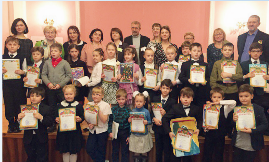
Награды нашли своих победителей