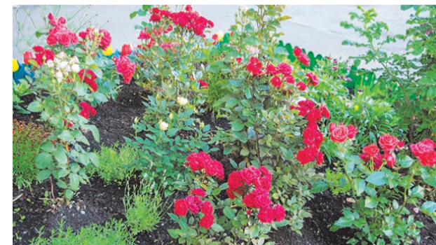
Розы, выращенные И.П.Смирновой у подъезда