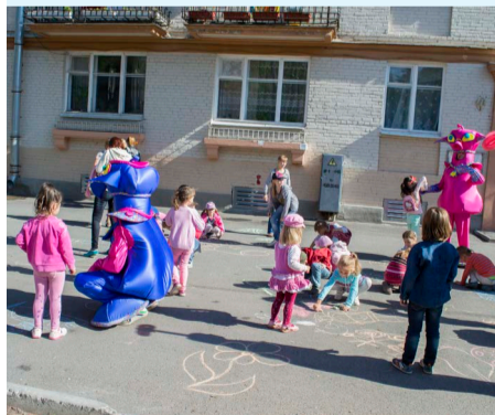
На снимке: «Праздник двора» на площадке у домов №№ 4-6 по улице Попова – «Космическое путешествие Незнайки».

С большим успехом проходят по субботам в Стрельне «Праздники двора», организованные Муниципалитетом и посвященные Году Литературы. Ребята встречаются с персонажами любимых книг: Мери Поппинс, Алисой, Незнайкой, Винни-Пухом, героями русских народных сказок.