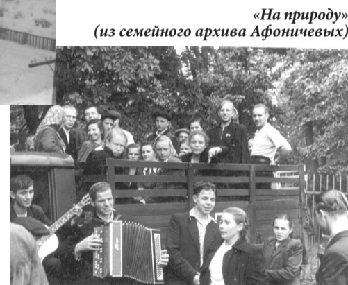
«На природу» (из семейного архива Афоничевых)

Дорогие стрельницы! К 70-летию Победы, совместно с библиотекой семейного чтения им. Ю. Инге, Местная администрация и Муниципальный совет готовят выставку - «Стрельна. 70 мирных лет» под девизом: «Фотография может рассказать больше, чем тысяча слов». Чтобы выставка была интереснее, нам нужна Ваша помощь - поделитесь с нами фотографиями из личных архивов. Их можно принести по адресу: Стрельна, Санкт-Петербургское шоссе, 69, кабинет 11, или прислать по электронной почте ( info@mo-strelna.ru ).