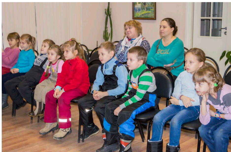
С большим успехом прошли в галерее Львовского дворца детские спектакли «Чукоккола», организованные муниципалитетом.