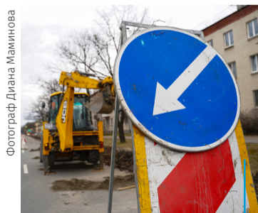
РЕМОНТНЫЕ РАБОТЫ НА САНКТ-ПЕТЕРБУРГСКОМ ШОССЕ

Также в рамках контракта местной администрации МО пос. Стрельна на уборку и са-