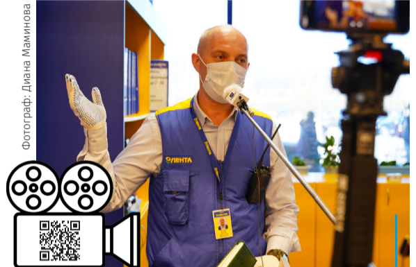
Если вы оказались в сложной жизненной ситуации и нуждаетесь в помощи, оставьте заявку на сайте «Дари еду!»

Благотворительные контейнеры находятся на входе в торговую зону. Каждый желающий может оплатить продукты, которые хочет передать нуждающимся,