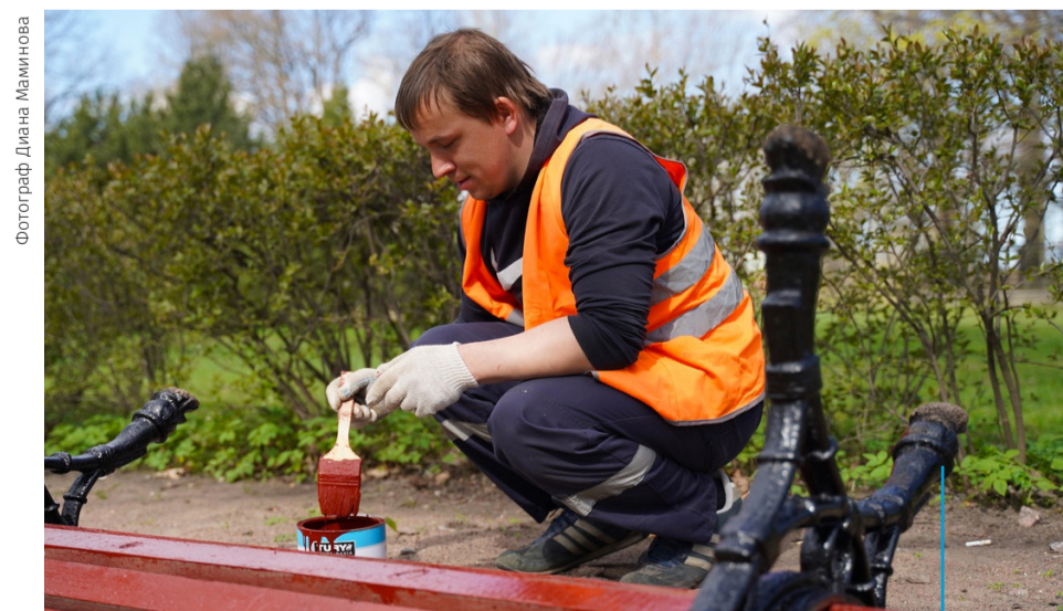
СОТРУДНИКИ КОМПАНИИ ГУСПП «ФЛОРА» КРАСЯТ СКАМЕЙКИ В СКВЕРЕ У ЛЬВОВСКОГО ДВОРЦА

20 мая в рамках ведомственной целевой программы «Благоустройство территорий муниципального образования» и муниципальной программы «Участие в реализации мер по профилактике дорожно-транспортного травматизма на территории муниципального образования» в Стрельне были произведены: