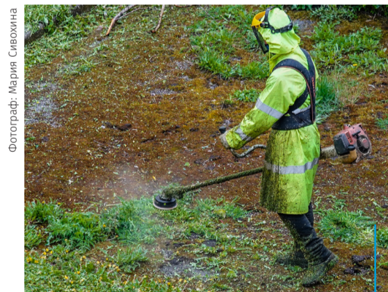
РАБОТНИКИ ООО «ВОСХОД» ОСУЩЕСТВЛЯЮТ ПОКОС ТРАВЫ В СТРЕЛЬНЕ

нитарную очистку территории, основываясь на положениях «Технологического регламента выполнения работ по уборке внутриквартальных территорий Санкт-Петербурга, входящих в состав земель общего пользования», который утверждён распоряжением Жилищного комитета Правительства Санкт-Петербурга от 18.07.2016 № 897-р., в поселке производится выкашивание травы на газонах. Покос травы в посёлке осуществляет ООО «Восход». Настоящим контрактом предусмотрены покосы, не менее пяти раз за сезон. Контракт заключён на срок по 31 декабря 2020 года.