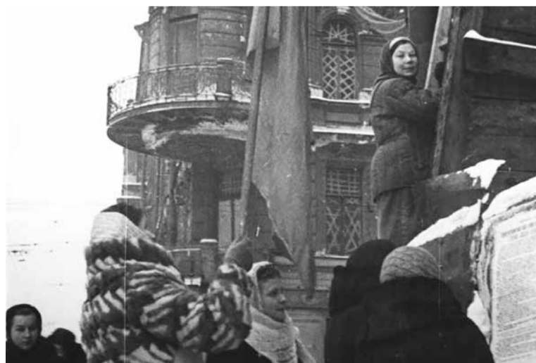
На проспекте 25 Октября в День прорыва блокады. 18 января 1943 года