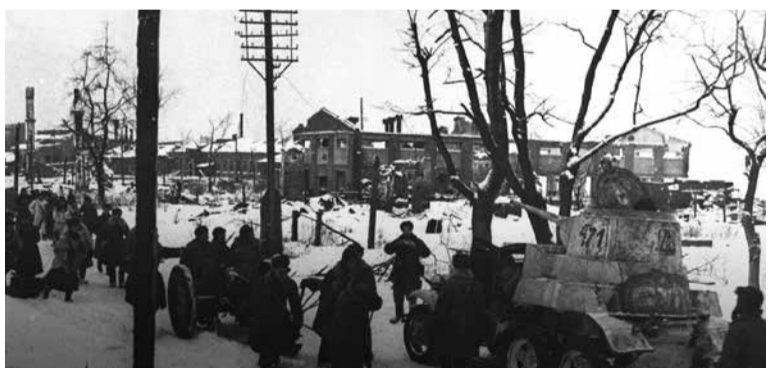
Бойцы на улице освобожденного Шлиссельбурга. 20 января 1943 года