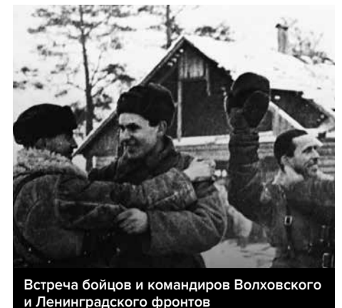
Встреча бойцов и командиров Волховского и Ленинградского фронтов