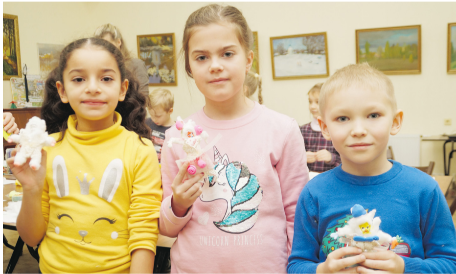
Изготовить ёлочную игрушку — познать волшебство