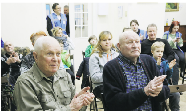
ЛЕКЦИЯ О МАЛЫХ НАРОДАХ СЕВЕРА БЫЛА ИНТЕРЕСНА ВСЕМ ПОКОЛЕНИЯМ СТРЕЛЬНИНЦЕВ