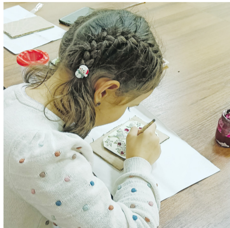
КАЖДЫЙ СПОСОБЕН ПРЕВРАТИТЬ СЕРЫЙ ГИПС В ЯРКИЙ И ПЁСТРЫЙ