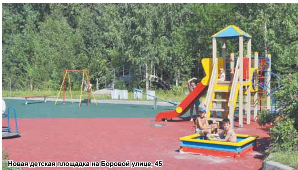
Новая детская площадка на Боровой улице, 45

ритории между домами 2 и 4 по улице Львовской. Здесь уже частично заменено покрытие. У местной администрации возникли вопросы относительно качества выполненных работ, и подрядчика обязали устранить выявленные недочеты. Представители муниципалитета встретились с жителями соседних с площадкой домов. Они попросили муниципалов установить на площадке дополнительное оборудование. Отдельный разговор касался обустройства пе-