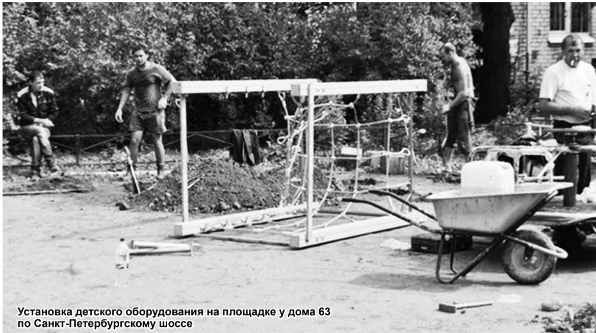
Установка детского оборудования на площадке у дома 63 по Санкт-Петербургскому шоссе