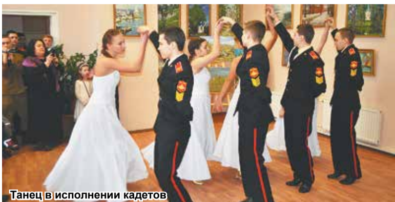
Танец в исполнении кадетов